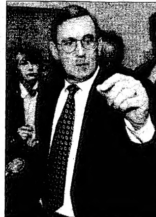
دوفان كابل عمالي يبروز جاز يتحدث الصحافيين